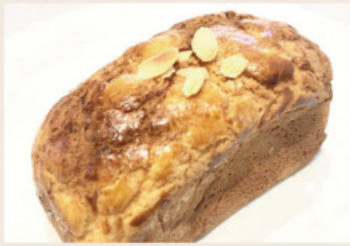
葡萄奶酥波羅 (蛋奶素)