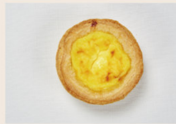
葡式起酥蛋塔 (蛋奶素)