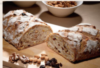
裸麥高纖 (奶素含酒) NT$200 ★週三限定版