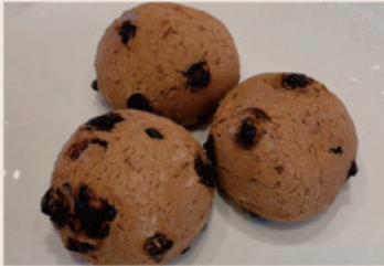
巧克力韓國麵包 (蛋奶素) NT$60