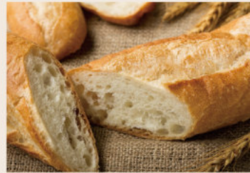
法國麵包 (全素) NT$110