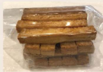
香酥烤吐司 (蛋奶素)