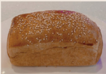
芋泥奶皇肉鬆 (葷食) NT$70