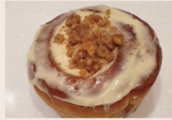
👑 肉桂卷 (蛋奶素含酒)