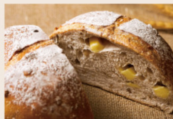
芭蕾堅果 (蛋奶素) NT$260 ★週三限定版