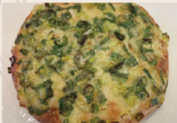
👑 三星蔥麵包 (植物五辛素)