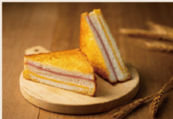
👑 起士三明治 (葷食)