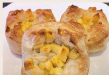
法式起司餐包 (蛋奶素) NT$60 ★週三、六、日限定版