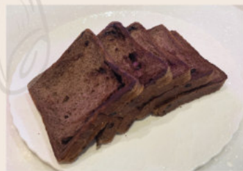
生巧克力吐司 (奶素)