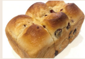
超熟蔓越莓吐司 (蛋奶素食酒)