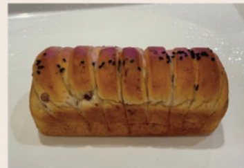
紅豆小吐司 (蛋奶素)