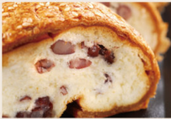
👑 起酥紅豆 (蛋奶素)