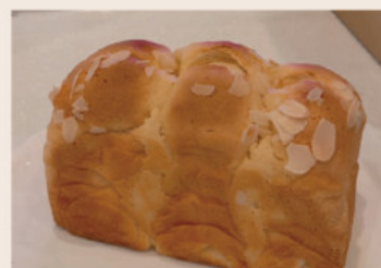
巴布羅吐司 (蛋奶素)