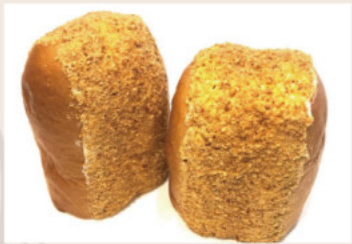
古早味花生夾心 (蛋奶素)