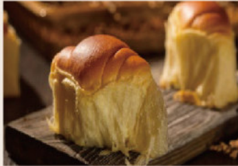
👑 手撕麵包 (蛋奶素)