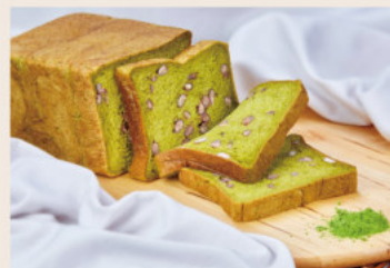
抹茶生角食 (奶素) NT$300 ★週三限定版