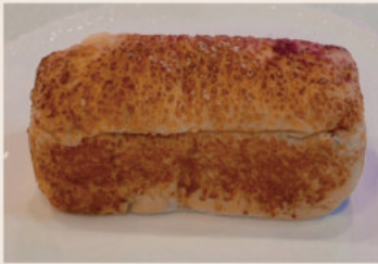
核桃起司 (蛋奶素) NT$55