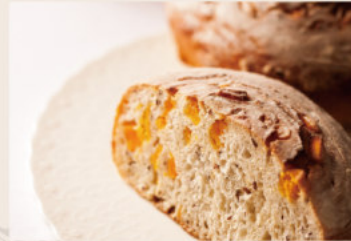
樂活地瓜 (全素) NT$160