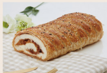
經典麵包 (葷食) NT$180 ★週三限定版