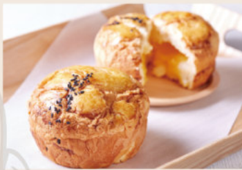
奶皇麻糬波羅 (蛋奶素)