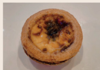
葡式酥皮蛋塔(黑糖Q心) (蛋奶素)