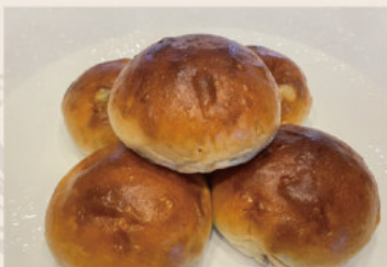
葡萄餐包 (蛋奶素含酒)