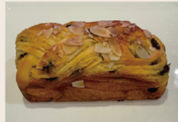
古早味椰香葡萄 (蛋奶素)