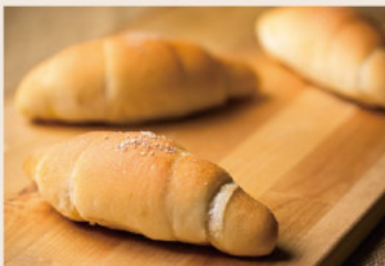
鹽之花奶油捲 (奶素) NT$120