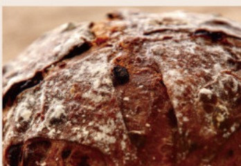
👑酒香桂圓 (全素含酒) NT$230