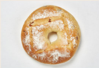
蔓越莓乳酪 (奶素含酒) NT$68