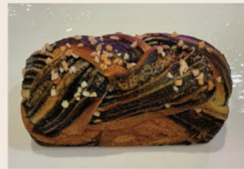
古早味芝麻麵包 (蛋奶素)