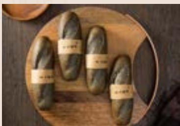
20/ 芝麻軟法 NT$75 (奶蛋素)