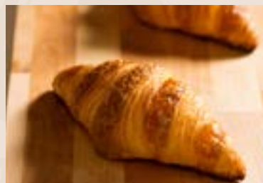
24/ 牛角麵包 NT$80 (奶蛋素)