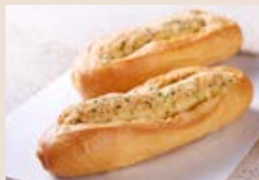
22/ 蒜香法國 NT$80 (葷食)