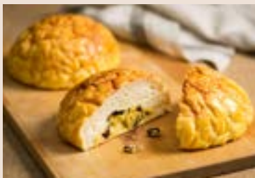
15/ 巨蛋波羅 NT$140 (奶蛋素)