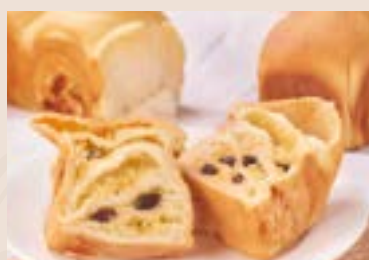
10/ 椰香三重奏 NT$160 (奶蛋素)