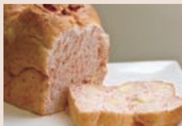
(週一、三、五、六、日不供應) 09/ 紅麴胚芽起士 NT$190 (奶素)