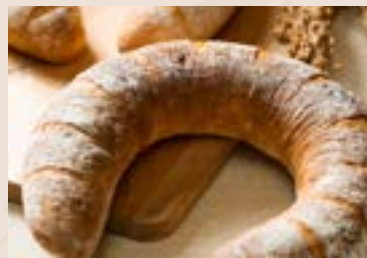
(每週不定時供應) 36/ 橙香乳酪 NT$190 (奶素)