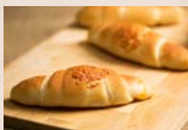
13/ 起司奶油捲 NT$140(3入) (奶素)