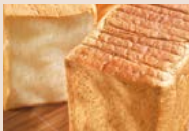
02/ 全麥吐司 NT$170 (奶素)