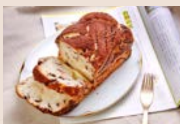
06/ 巧克力大理石 NT$170 (奶蛋素)