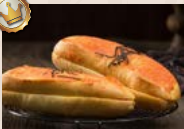
21/ 明太子法國 NT$95 (葷食)