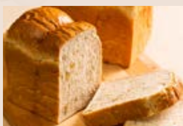
07/ 玄米堅果吐司 NT$190 (奶素/含堅果)