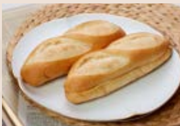
19/ 維也納 NT$75 (奶素)