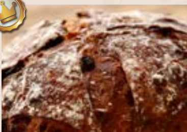
(每週不定時供應) 33/ 酒香桂圓 NT$240 (葷食含酒/含堅果)