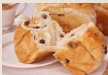
03/ 葡萄吐司 NT$155 (奶蛋素)