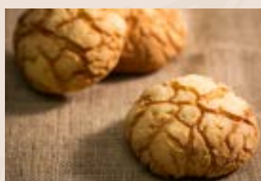
14/ 日式波羅 NT$135(3入) (奶蛋素)