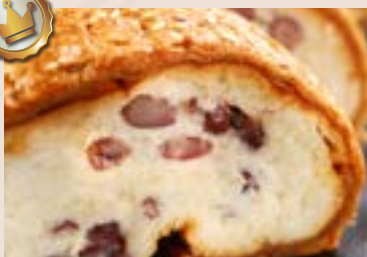
滾滾長江東逝水 18/ 起酥紅豆麵包 NT$200 (奶蛋素)