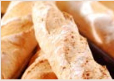
(每週不定時供應) 30/ 核桃法國麵包 NT$160 (全素/含堅果)