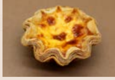
43/ 千層蛋塔 NT$80 (奶蛋素)