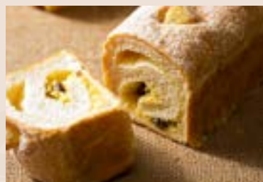
25/ 甜酥香栗 NT$190 (奶蛋素)