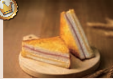
41/ 起士三明治 NT$65 (葷食)