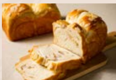
04/ 芋頭吐司 NT$160 (奶蛋素)