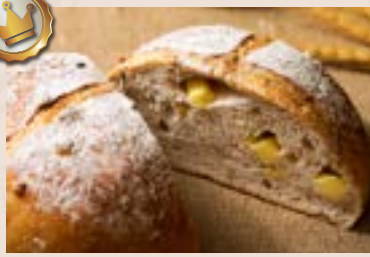
26/ 芭蕾堅果 NT$280 (奶蛋素/含堅果)