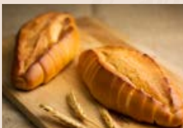
16/ 鹽味香頰 NT$135 (奶蛋素)