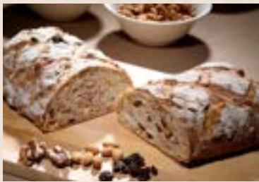
(每週不定時供應) 32/ 裸麥高纖 NT$220 (奶蛋素/含堅果)