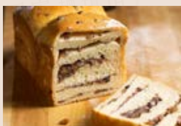
05/ 松子紅豆吐司 NT$210 (奶蛋素)