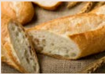
(每週不定時供應) 29/ 法國麵包 NT$120 (全素)