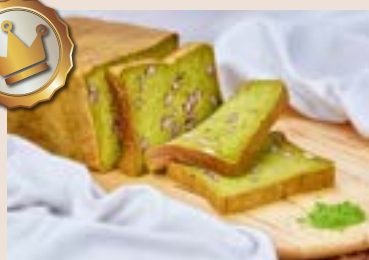
(週一、六、日不供應) 08/ 抹茶生角食 NT$250 (奶素)