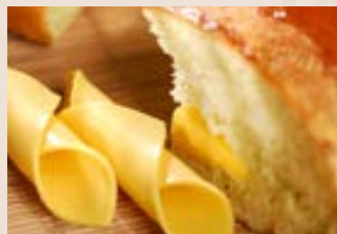
23/ 德島海苔哈斯 NT$130 (奶蛋素)