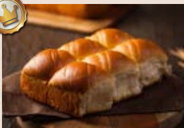
17/ 手撕麵包 NT$200(6入) (奶蛋素)