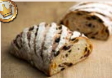
(每週不定時供應) 31/ 水果多重奏 NT$220 (奶素)