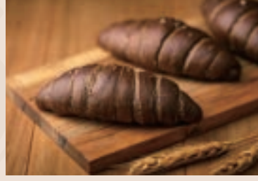
42/ 巧克力鹽之花 NT$130 (奶素)