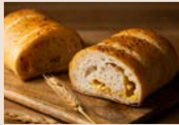
(週六、日不供應) 38/ 雙起司燻雞堡 NT$190 (葷食)