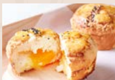
11/ 奶黃麻糬 NT$65 (奶蛋素-鴨蛋黃)