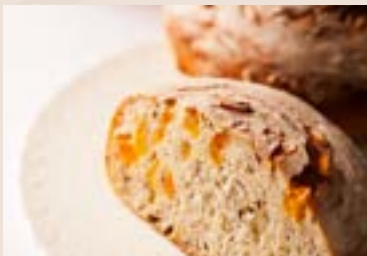
(每週不定時供應) 34/ 樂活地瓜 NT$180 (全素)