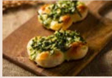
39/ 青蔥麵包 NT$70(2入) (植物五辛素)