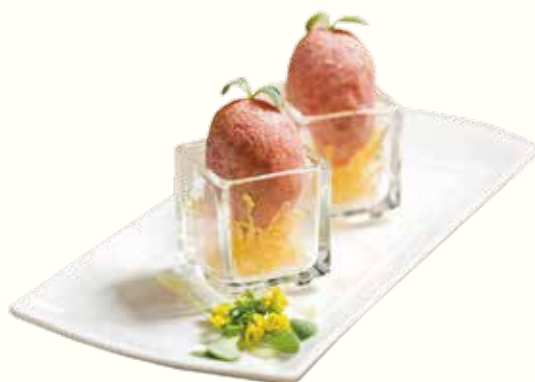
龍蝦芝士鹹水角 NT$240/2入 ロブスター、チーズ入り揚げギョーザ Deep-fried Dumpling with Lobster Meat and Cheese