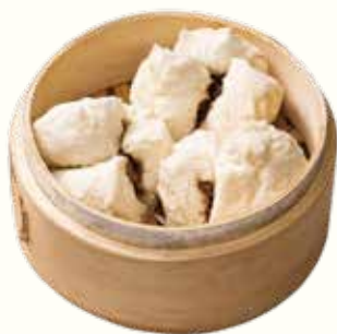
蜜汁叉燒包 NT$180/3入 チャーシューまん Steamed BBQ Pork Bun

以上價格需另加一成服務費。10% Service Charge Will be Added to Your Bill 以上の価格に10%のサービス料が加算されます。