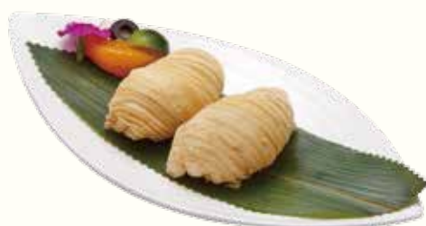
蘿蔔千絲酥 NT$160/2入 中華風大根入りロール揚げ Puff Pastries Filled with Shredded Turnip