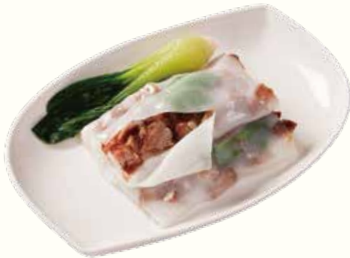
梅香叉燒腸粉 NT$180/份 チャーシュー入りライスヌードル蒸し /梅風味 Rice Noodle Roll with Pork Preserved Vegetables