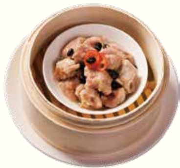
豉汁蒸排骨 NT$180 ポークリブのトウチソース蒸し Steamed Pork Spare Ribs with Black Bean Sauce