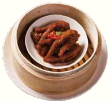
什醬蒸鳳爪 NT$180 鶏の爪の醤油蒸し Braised Chicken Claw with Soy Sauce