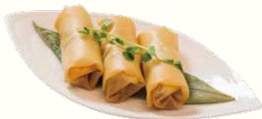
韭黃雞絲春捲 NT$150/3入 鶏肉とニラの揚げ春巻 Chicken with Leek Spring Roll