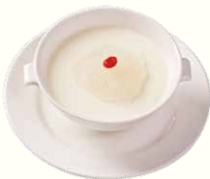
燕窩燉鮮奶 (熱) NT$580/位 ツバメの巣のミルク煮 Steamed Bird's Nest with Milk (Hot)