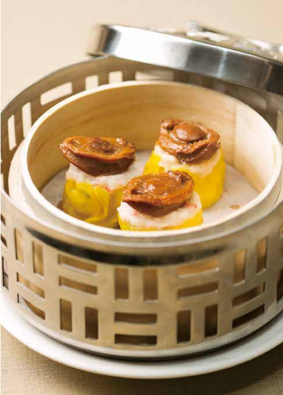
鮑魚燒賣 アワビシューマイ Abalone Shaomai