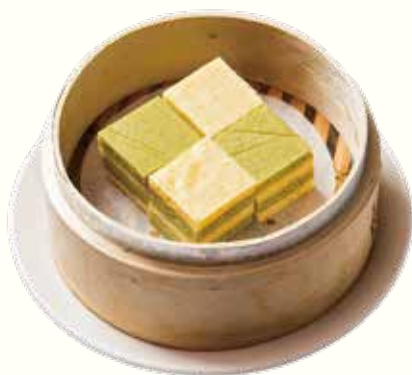
抹茶千層馬拉糕 NT$240/4入 中華風スポンジケーキ/抹茶風味 Steamed Green Tea Malar Cake