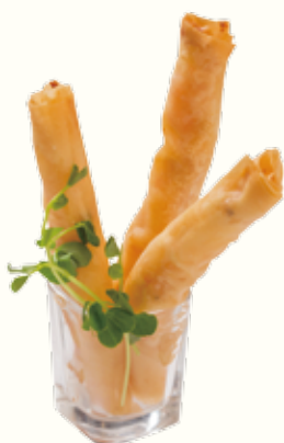
蒜蓉蝦春捲 NT$180/3入 エビ入り揚げ春巻き/ガーリックソース Garlic Shrimp Spring Roll

以上價格需另加一成服務費。10% Service Charge Will be Added to Your Bill 以上の価格に10%のサービス料が加算されます。