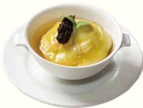
羊肚菌灌湯包 NT$360 アミガサ茸入り小籠包スープ Morel Bun in Soup

以上價格需另加一成服務費。10% Service Charge Will be Added to Your Bill 以上の価格に10%のサービス料が加算されます。