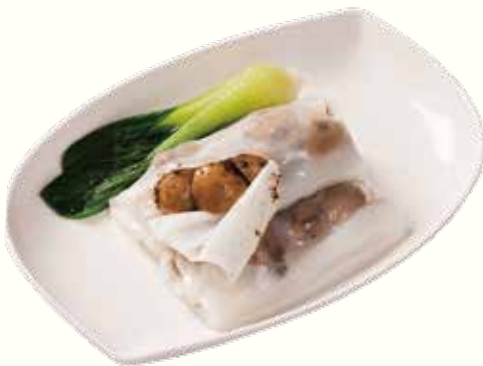
松露菌素腸粉 NT$200/份 野菜、トリュフ入りライスヌードル蒸し Vegetarian Rice Noodle Roll with Truffles

以上價格需另加一成服務費。10% Service Charge Will be Added to Your Bill 以上の価格に10%のサービス料が加算されます。