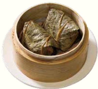
瑤柱珍珠雞 NT$180/2入 ホタテと鶏肉入り御飯の蓮の葉包み蒸し Sticky Rice and Chicken Meat in Lotus Leaf (per serving)