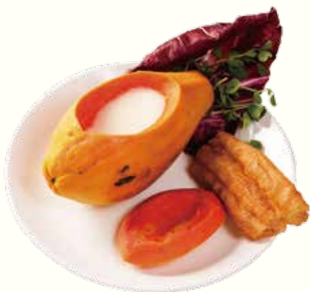
杏汁木瓜 (熱) NT$320/位 パパイヤアーモンドミルク Papaya Almond Milk (Hot)