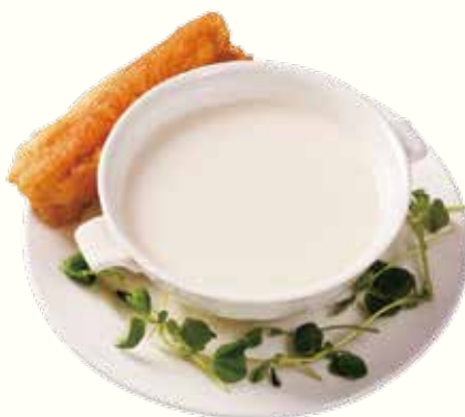
杏汁奶露 (熱) NT$180/位 アーモンドミルク Almond Milk (Hot)

以上價格需另加一成服務費。10% Service Charge Will be Added to Your Bill 以上の価格に10%のサービス料が加算されます。