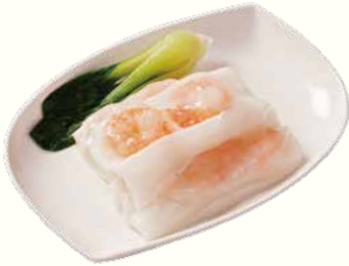
鮮蝦滑腸粉 NT$220/份 エビ入りライスヌードル蒸し Rice Noodle Roll with Shrimp