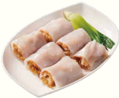
百花油條腸粉 NT$240/份 揚げパン入りライスヌードル蒸し Chinese Fritter with Rice Noodle Roll