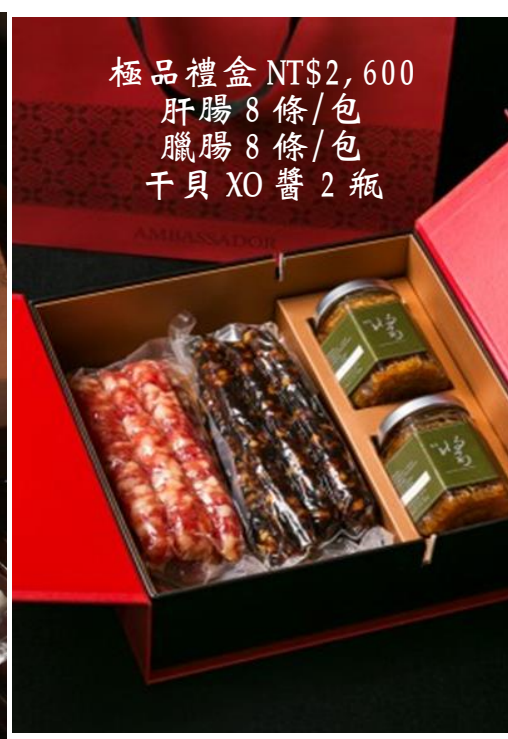
極品禮盒 NT$2,600 肝腸 8 條/包 臘腸 8 條/包 干貝 XO 醬 2 瓶